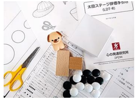
太田ステージ評価用具（LDT-R）の一部