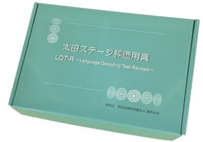
太田ステージ評価用具（LDT-R）パッケージ